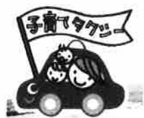
このステッカーが目印！

子育てタクシー®というサービスがあります。港北区では、2011年2月からサンタタクシー株式会社が加盟、パートナーとしてびーのびーのが情報提供や運転手の実習体験の場として協力を行っています。