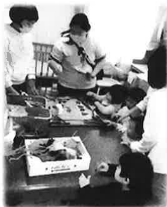
みんなで作ってます

今年は「秋の拾いもの」 をテーマに楽しい作品を 作りました。 菊名ご近所文化祭 2020 ギャラリー&スペース弥平 <篠原北 1-5-5> 11月28日~12月6日 10時~16時 開催中! お散歩のついでに 寄ってくださいね。